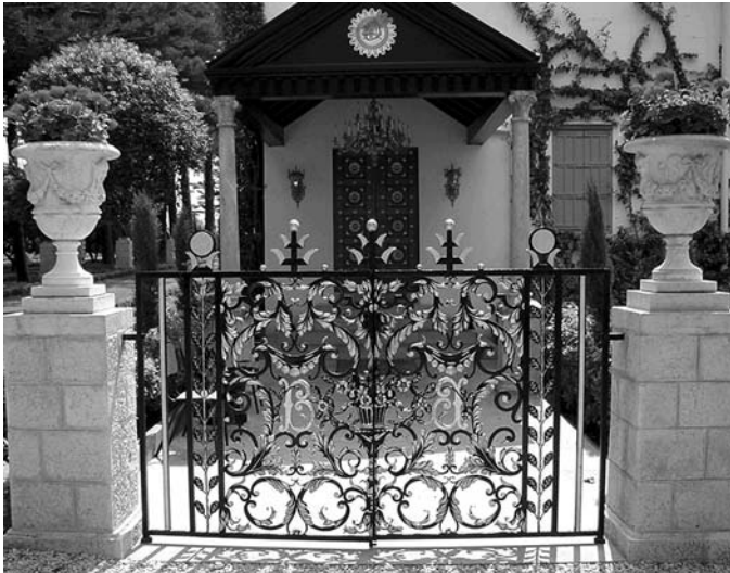
The Gate to the Holy Precinct