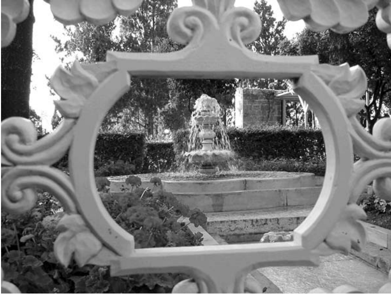
A fountain in Ridván Garden