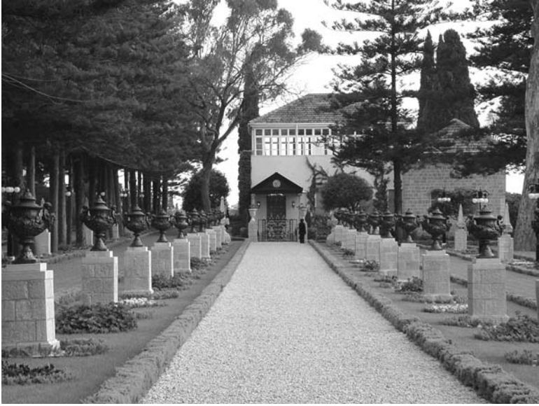
Property around the Holy Precinct